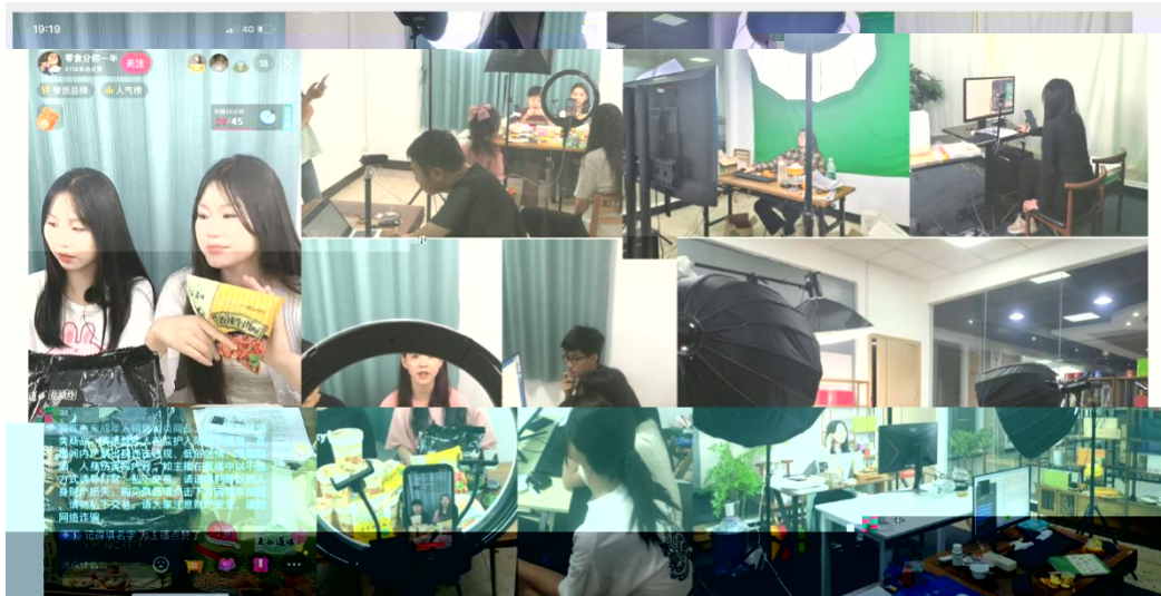
部份学员在课堂上进行电商直播实训现场