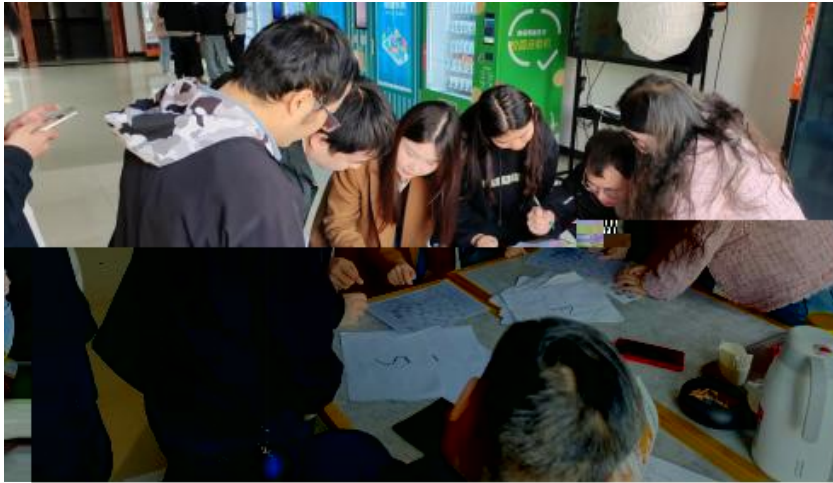
图 卓越团队建设共识营